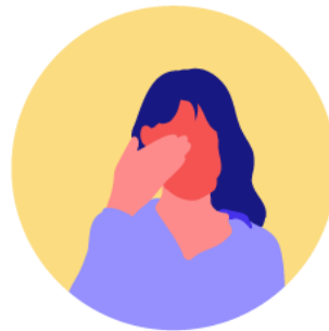
Dolor de cabeza

En caso de tener dificultad para respirar , acude a un médico.