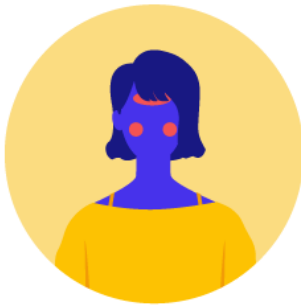
Fiebre sobre 37,8°

Los siguientes síntomas se puede dar juntos, o por separado: